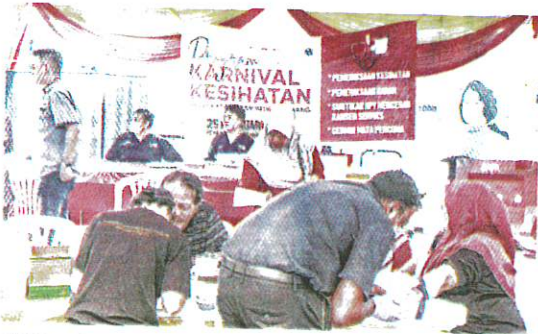
GAMBAR fail pemeriksaan kesihatan yang diadakan secara berterusan di daerah Klang, Selangor.

KUALA LUMPUR – Kementerian Kesihatan (KKM) sedang mempertimbangkan penubuhan Dana Kesihatan Negara bagi memastikan pengagihan dana kesihatan yang telus di negara ini.