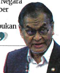
Dr Dzulkefly Ahmad, Menteri Kesihatan

Penubuhan Dana Kesihatan Negara akan mengumpul pelbagai sumber pembiayaan yang dirancang termasuk daripada hasil cukai, bukan cukai dan juga dana dikhaskan