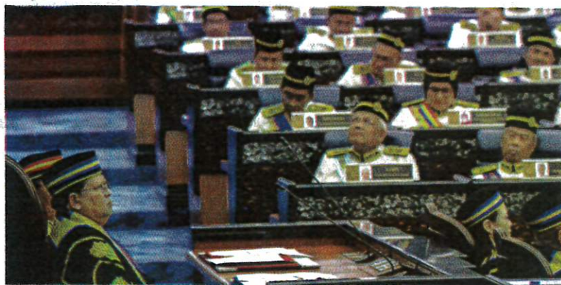
Ahli Dewan Rakyat diminta menjalani pemeriksaan kesihatan selewat-lewatnya pada 11 November depan.