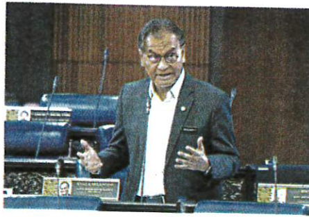
DR Dzulkefly pada sesi soal jawab pada persidangan Dewan Rakyat, semalam.

"Kami sentiasa mahu memberikan sokongan andai ia tidak membebankan rakyat dan fasiliti kesihatan kerana jika ramai tidak berinsurans, maka mereka akan beratur di fasiliti kesihatan," katanya sewaktu